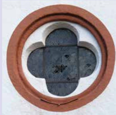
Kloosterkerk Niederehe, Eifel, Duitsland