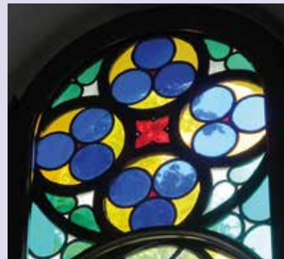
Sjöbo, Skåne, Zweden

Naar we hopen even kleurrijk als dit plaatje. Wim Wattel