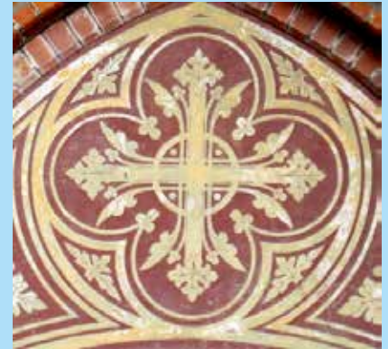
Dom van Schwerin, Duitsland

geen sprookjes! Info, mededelingen, verslagen, plannen, daar gaat het om. Zie dit praatje-bij-een-plaatje dus maar als (overbodige?) verfraaiing. Nee – niet overbodig, want u bent er mee binnengelokt. Nu verder lezen! Wim Wattel