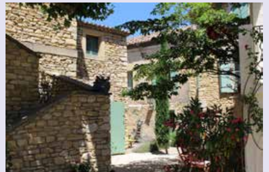
Kijkje op de binnenplaats van het Centre Erasme in St Etienne des Sorts (op ongeveer een half uur rijden van de steden Orange en Avignon)