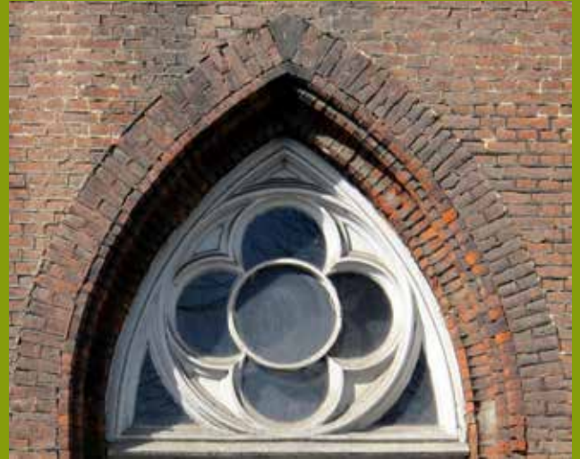
Sint-Michielskerk Gent, België

2018 went alweer. Februari is zo'n maand waarin alles gewoon doorgaat. Geen spectaculaire dingen, geen hoogstandjes, althans niet met onze dicht-bij-huis bril op. Een echte sprokkelmaand, precies vier weken kort. Vier zondagen, vier maandagen, enzovoort, alleen het gewone werk. Maar ook dat heeft z'n charme.