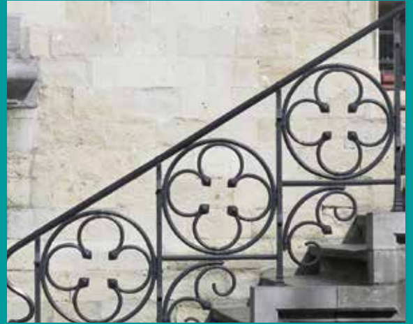
Belfort Gent, België

Sinterklaas – Advent – Kerst; de decembermaand heeft altijd iets van een drietrapsraket: feest op feest, het kan niet op. Misschien heeft u in uw schoentje aangevulde verrassingen aangetroffen. Misschien heeft u kaarsjes gebrand, vol verlangen naar nieuw licht. Misschien met overgave gezongen: "Gloria in Excelsis!"