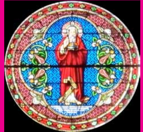
Saint-Lazare, Avallon, Yonne, Frankrijk

Mijn foto van dit hoge vierpasvenster is helaas niet mooi scherp (te hoog gegrepen), maar wel tekenend: Vanouds wordt de Salvator Mundi afgebeeld als een figuur met twee vingers van de rechterhand opgestoken in een zegenend gebaar en in de linkerhand een glazen bol. Die stelt de wereld voor en is vaak voorzien van een kruis of, zoals hier, van in kruisvorm gewikkelde banden. Ook Leonardo da Vinci schilderde hem, zoals u ongetwijfeld weet... Wim Wattel