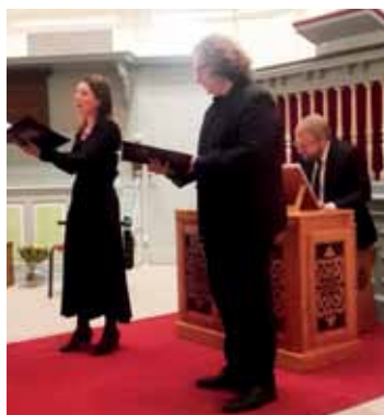
Stabat Mater van Pergolesi: