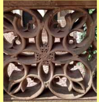
Wartburg bij Eisenach, Thüringen, Duitsland