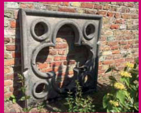
Verdwaalde steen in Veere