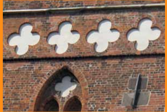
Marienkirche Lübeck, N-Duitsland

Eén van de welvarende Hanzesteden van weleer is Lübeck, aan de Oostzee. In deze Baltische regio vind je veel zgn "baksteengotiek" – een eigen versie van de gotiek, ontstaan bij gebrek aan de importmogelijkheid van natuursteen. Op de toren van deze Marienkirche