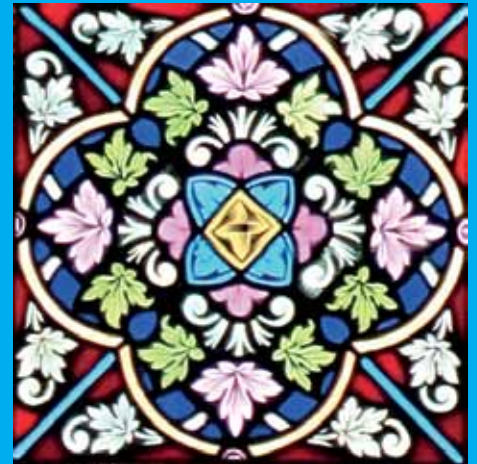
Église Notre-Dame Noyers, Yonne, Frankrijk

"An optimist is the human personification of spring", lees ik vandaag (21 maart) op mijn kalenderblokje van 2017. "Bron onbekend", staat erbij. Vaak moeten we het daar maar gewoon mee doen. Om eerlijk te zijn: ik heb dit plaatje een beetje gemanipuleerd om een storend dwarsbalkje weg te werken. Soms kies ik daar voor, anders wordt mijn aandacht maar afgeleid van wat er werkelijk toe doet. Ook in ons leven kunnen zulke balkjes lelijk dwarsliggen... Wim Wattel